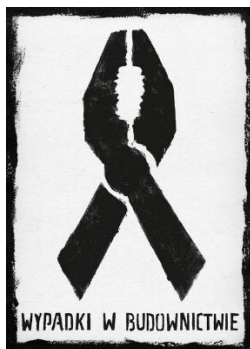
I nagroda Aleksandra Kortas „Wypadki w budownictwie”